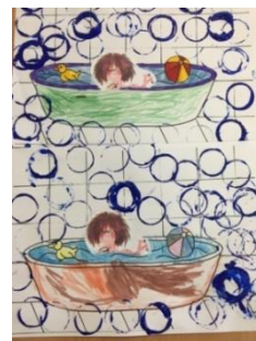
Floddertje in een schuimbath gemaakt door groep 1 en 2